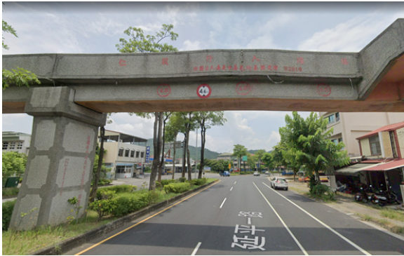
上圖：仁毅橋近況。

稍有不慎則將造成學童的危險。因此本團當年以千萬善款來重建陸橋，並命名為「仁毅橋」，至今仍屹立於當地守護學童的安全。大約在民國一〇四年左右，一對母子來到團本部，即是當年那位卡車司機的妻兒，兒子已經三十多歲，是電腦公司總經理。他們對本團當年協助重建陸橋仍感謝不已，更贈送一套電腦網路管理軟體回饋。這也見證了善念是可以傳遞，一項善舉可以讓社會更加美好。