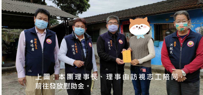
上圖：本團理事長、理事由訪視志工陪同，前往發放慰助金。

罹患胸腺惡性腫瘤，需長期至醫院回診治療，阿塗是家中唯一經濟來源，因病無法再工作，一家人經濟陷入困境，向本團請求協助。【登錄案號：202203028】