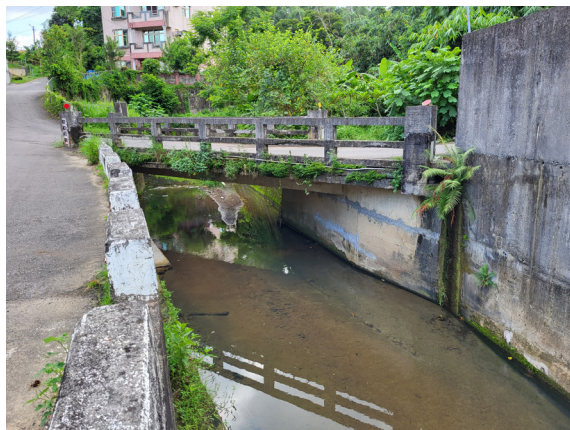
上圖：玄明橋。橋下溪水看似平靜，但在溪水暴漲時是相當湍急危險。