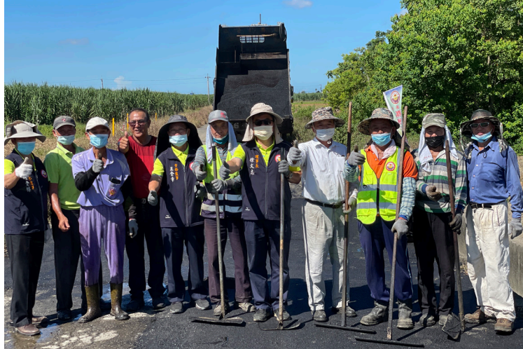
上圖：本團理事長、常務理事與補路組志工，一同在烈日下為布袋鎮鄉親補路。

路面的破損、坑洞，對於四輪以上車輛只不過是感覺顛簸，但對於摩托車騎士而言，就可能造成生命的危害。尤其在步入夏季的柏油路面，在太陽照射下溫度相當高，過去就曾發生有農民騎車時因為道路坑洞而摔倒昏迷，昏迷過程中又被高溫的路面燙到灼傷的情況。原本就已經因為車禍受傷，再加上被路面灼傷，傷上加傷，更是慘重。因此，有一條平整安全的道路，就更顯得重要。因此本團的補