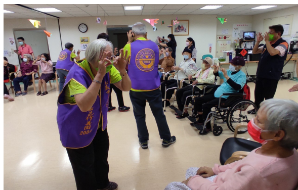
上圖：本團「心橋志工」於四月十二日「陽明日照中心民權站」活動。

本團希望拓展志工服務項目與業務，因此有了「心橋志工」的成立，期望讓志工經過培訓，使本團面對未來超高齡社會，有更多行善方式的發展與可能性。由「造新橋」轉型為「造心橋」，從物質提供進化到心靈層面的陪伴，使志工服務更具深度。