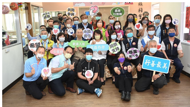
上圖：因應社會趨勢開始投入長照志工的領域，獲嘉義市府肯定。

嘉義市長黃敏惠表示，過去行善團出錢出力造橋鋪路，現在行善團再次提升，不只是造橋，更要搭心橋，讓你我之間心靈有更多的溝通；行善不止在硬體、物資的提供而已，更進入到心靈的層次。對於嘉義市為幸福城市而言，這是一個重要的環節，因為幸福來自每一個人無私地付出，讓彼此用心關懷，形成溫暖的善良力量。嘉義社區發展教育事務基金會董事長李錫津也表示，所謂「橋」就是幫助我們跨越障礙，造橋有人做但心橋一直沒有人做，「心橋志工」從今