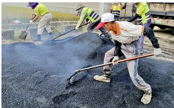
上圖：本團補路義工四處奔波為民眾鋪平道路。