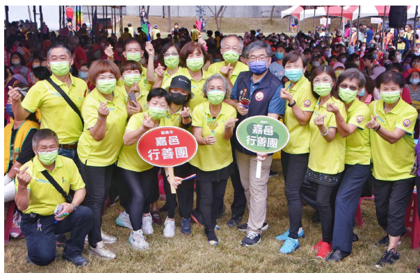
上圖：12月5日國際志工日。

我們都希望每一位長輩能與社會有更多正向連結，心靈富足了，不僅有益身體健康還能延緩老化。下列與大家分享精彩的心橋剪影！