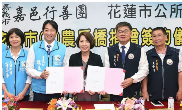
上圖：與花蓮市公所共同簽署捐贈合作契約。