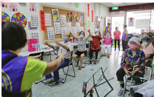
上圖：10月24日芳安巷弄長照站。