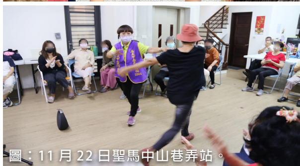
圖：11月22日聖馬中山巷弄站。