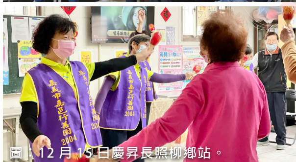
圖：12月15日慶昇長照柳鄉站。