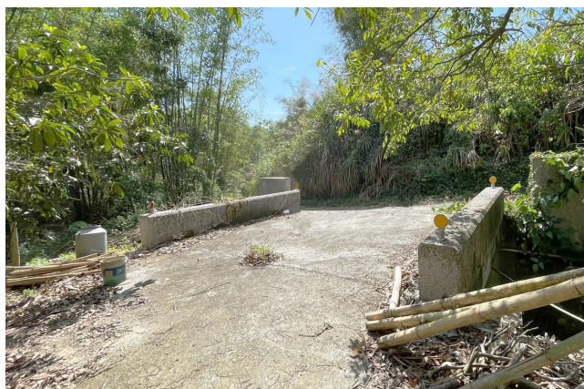
上圖：仁重橋另一端。