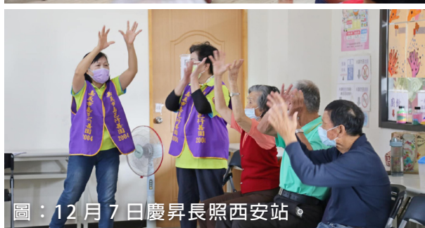
圖：12月7日慶昇長照西安站。