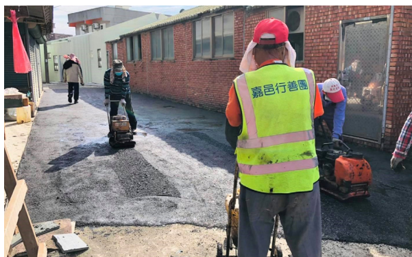
上圖：補路義工為菜公村村民補平道路。

過去也曾有需要修補的路面積較大的區域，也曾協調由鄉公所出資雇用大型機具設備和專業技術工一同協作。因為考量瀝青工程是高溫作業，