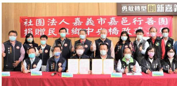
上圖：與嘉義縣政府進行改建工程捐贈簽約儀式。

中央橋位於鄉道嘉七十九線，跨越鴨母坵排水，是新港鄉與民雄鄉民眾前往國道一號中山高民雄交流道的主