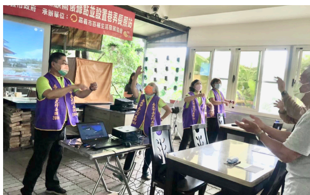
上圖：10月31日紅瓦厝社區。