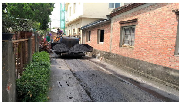
上圖：鄉公所出資大型機具一同協作。

近年本團補路組陸續在嘉義縣民雄鄉中和村、菁埔村、秀林村、新港鄉北崙村、菜公村、海瀛村、中洋村、大潭村等村落，以及太保市、雲林縣東勢鄉、虎尾鎮、斗南鎮等地服務。近三個月的時間，四處奔波。在勘查報請補路的地區，審核、備料之後，補路義工出勤 24 天，共修補了面積 1755 平方公尺的道路。此外，本團也持續捐贈瀝青混凝土包給各地方鄉鎮運用，捐贈的補路材料共計有 2200