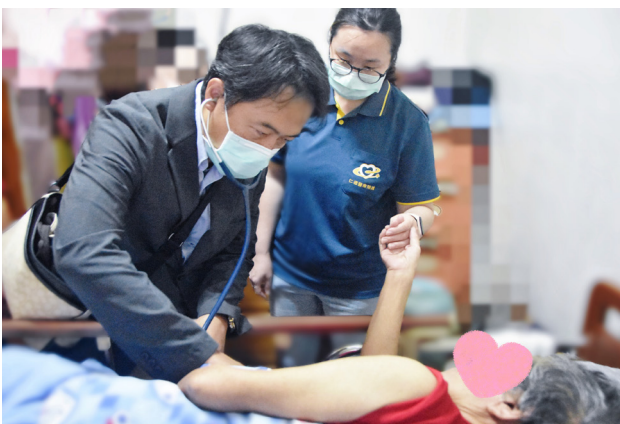
上圖：白醫師帶著資深傷口護理師及個管師走入社區看診，關心行動不便老人家。

徐理事長與白醫師希望這次的救助行動，可以啟發更多人投入醫養合一及醫療社福整合的領域，在公助、共助、自助助人及適切的資源分配下，讓每一個環節盡可能扣起來，不鬆掉，一起創造良善的循環，形成一股社會穩定的力量。