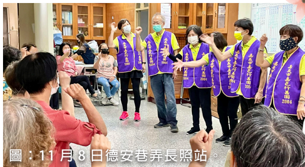
圖：11月8日德安巷弄長照站。