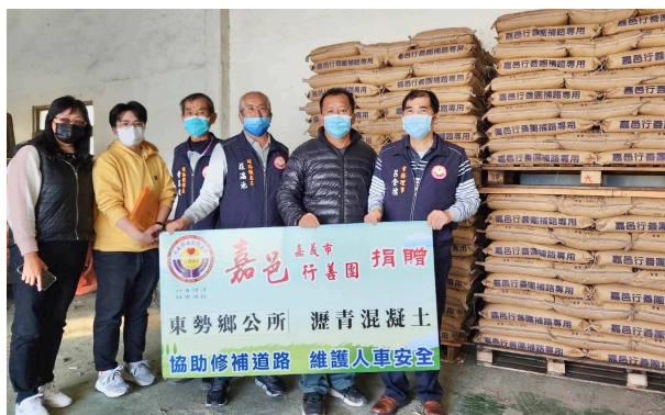
上圖：本團持續捐贈瀝青包給地方鄉鎮使用。

嘉義縣新港鄉與民雄鄉內大多是生產稻米為主的農村聚落，地方產業道路常是多年舊路。因長時間高溫日照和雨淋、車輛反覆輾壓，導致道路結構受損而產生凹陷和龜裂的情況。而且近年因為少子化與人口外移的影響，新港和民雄偏鄉地區以老年人口