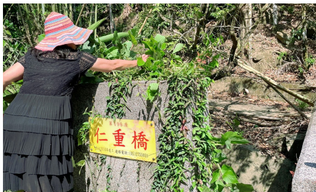
上圖：胡理事長帶路尋找仁重橋 (499)。