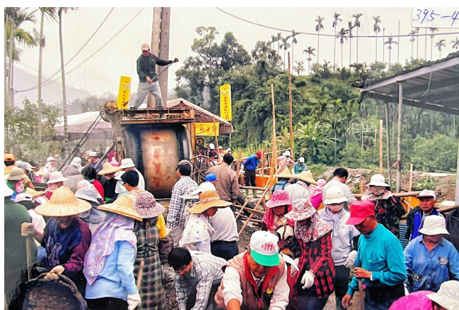
上圖：當年本團造橋義工與大南村民齊心協力修建仁承橋。

嘉義縣梅山鄉大南村內丘陵重疊，依地勢開渠引水，是盛產柳丁、香蕉、茂谷、荔枝、竹筍、檳榔等豐富作物的純樸鄉間聚落，水果農作的栽培產銷是該村經濟命脈，道路橋梁的興建更影響農產的對外運輸，本團歷年在村內興建的 10 座橋梁，造福山區農民，提供運輸交通上的便利。