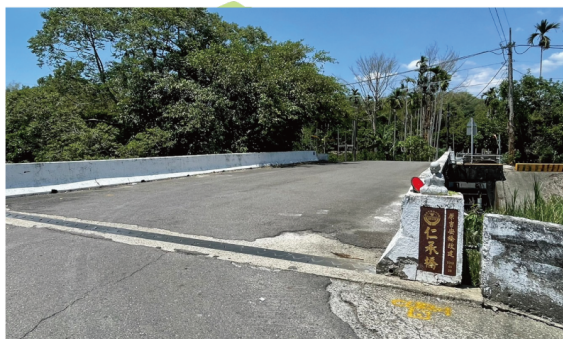
仁承橋 (395) (原「吉安橋」(40))