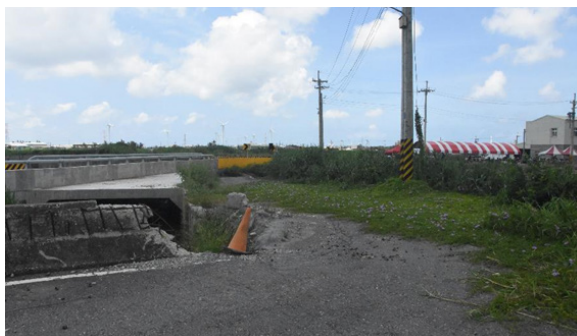
上圖：左側鋼筋外漏的物體是舊海埔橋破損的橋身，右側地面為舊路面，呈現90度轉角。