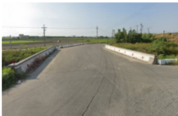
願心二號橋(534)，落成於105年1月，全長14.2公尺，位於雲林縣土庫鎮溪邊里，橫跨於嘉南大圳湳仔線上。