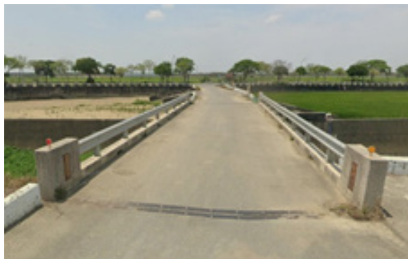
願心橋(483)，落成於103年7月，全長18公尺，位於台南市後壁區菁寮里，橫跨於崩埤大排之上。