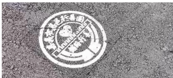
上圖：路面施作完成後，蓋上行善團的標誌，表示對品質與善款捐助人的負責。