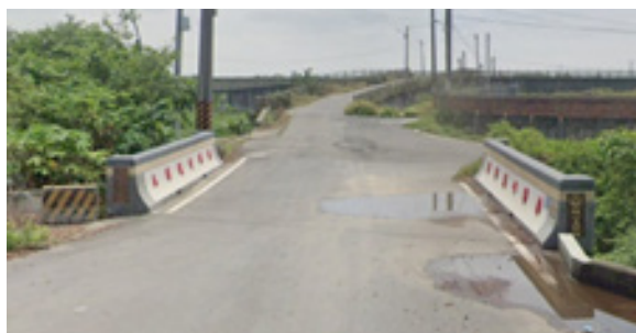
願心五號橋(620)，與四號橋同時落成於110年10月，兩橋僅相距約30公尺，各自橫跨於八掌溪支線上，是下潭村重要的交通要道。