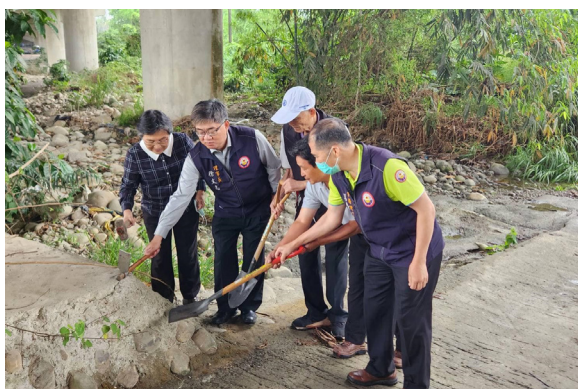
上圖：古坑鄉古坑台 78 線下過水管橋開工祈福儀式。