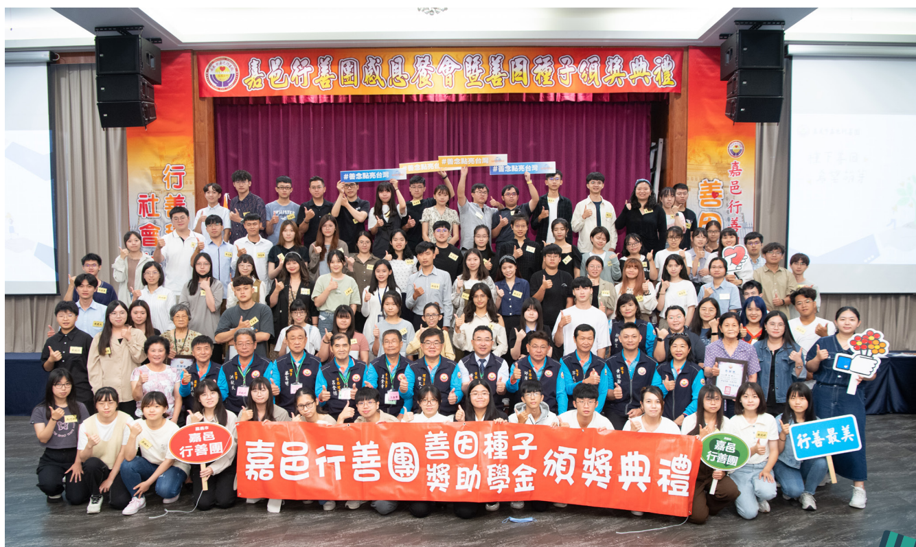
上圖：善因種子獎助學金頒獎典禮大合照，7月15日於嘉義市鈺通大飯店