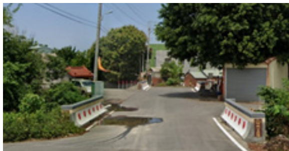
願心四號橋(619)，落成於110年10月，位於嘉義縣鹿草鄉下潭村，橫跨於八掌溪支線上，是下潭村重要的交通要道。