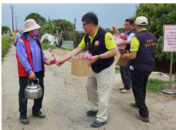
圖：施工告一段落，由理事長贈送康乃馨