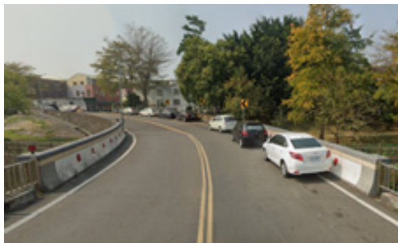
願心三號橋(554)，落成於106年8月，全長13.4公尺，位於嘉義縣水上鄉民生社區，為福德街橫跨八掌溪支流的橋樑，此處支流亦是水上鄉與嘉義市的縣界所在。