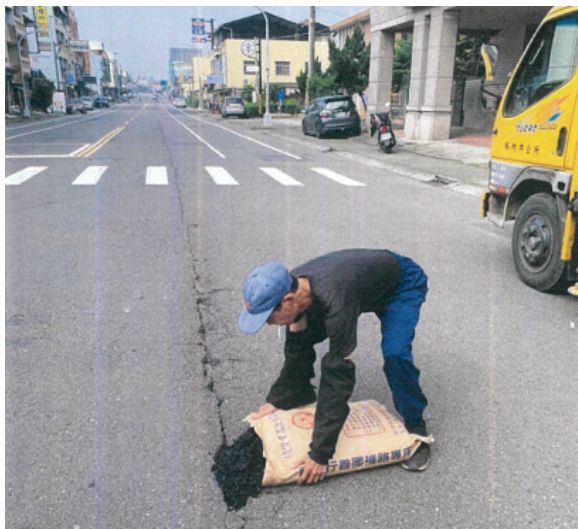
上圖：路面裂縫或坑洞的小範圍修補，常由各村里長或幹事逕行領取施作。