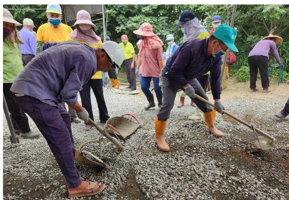
圖：義工進行橋面鋪設