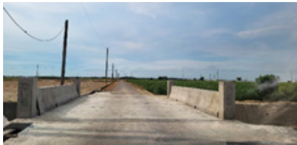
願心六號橋(630)，落成於112年7月，位於嘉義縣六腳鄉潭墘村，架設於六腳大排水溝的三義排水分線。