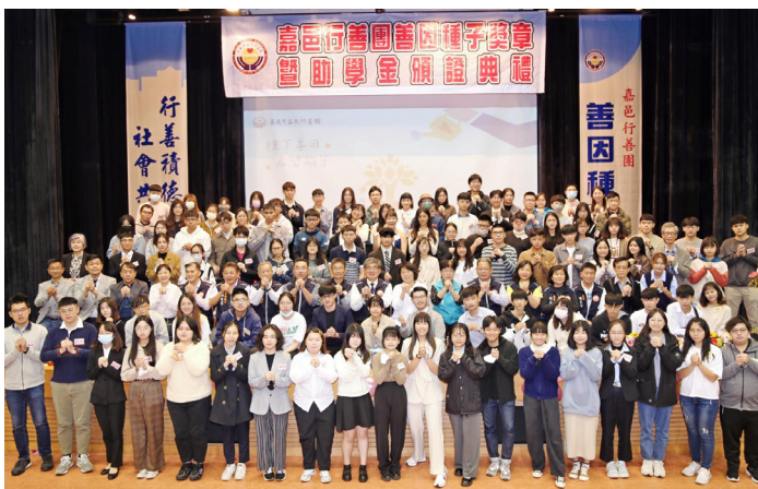
上圖：善因種子助學計畫首場頒獎典禮。

善因種子助學計畫首場頒獎典禮，在大家一片加油打氣聲中圓滿落幕，也祝福每位勇敢向前的善因學子，帶著這份支持的力量，為自己開拓更美好的將來！