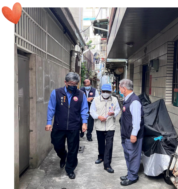
上圖：施棺慰問行程中親力親為尋訪案家。

102 年至 111 年這 10 年之間，補助的施棺件數已累計 17233 件，目前申請件數最多為雲林縣 3349 件、其次是嘉義縣 3063 件、台南市 2360 件、花蓮縣 2154 件、台東縣 1133 件、嘉義市 1114 件……，從各地紛飛而來的申請資料，了解到全台灣社會有太多生活身陷困境需要幫助的人，除了當地里長轉介的個案，有些是亡者家屬親友已走到「山窮水盡」無奈之下，親自懇請本團協助幫忙。