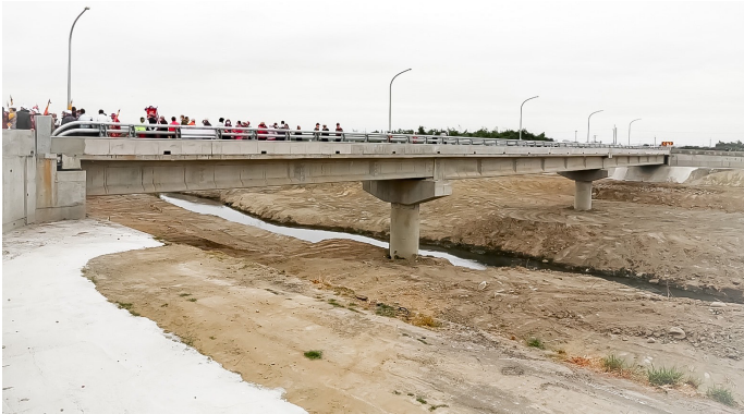
上圖：新善諸橋是重要救命通道，也是農作載運要道。

由嘉義縣政府、雲林縣政府、大埤鄉公所及本團等多方共同合作興建完成的新善諸橋，是本團在大埤鄉完成的第 27 座橋、雲林縣完成的第 175 座橋梁，整體工程費用近 7200 萬元，本團支出橋梁建造費 3400 萬元，嘉義縣政府實施南引道工程，雲林縣政府