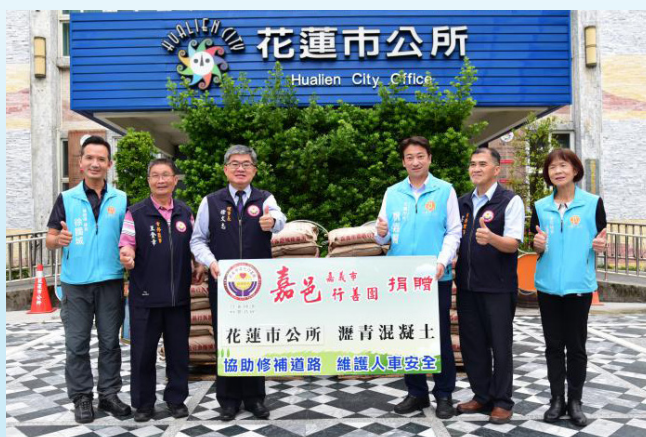
上圖：捐贈花蓮市公所1000包常溫瀝青，由花蓮市魏嘉賢市長代表接受。