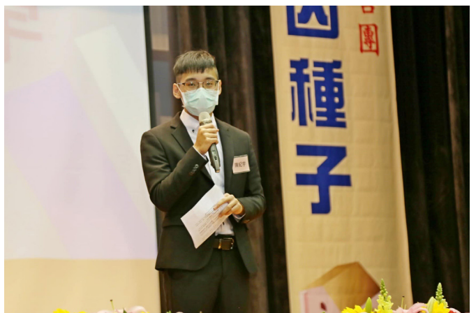
上圖：代表高雄科技大學陳同學發表感謝詞。