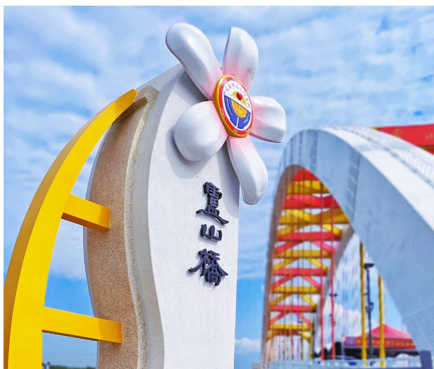
上圖：油桐花意象加入本團團徽，發揚行善精神。

除了援建新橋，將過去本團所建的橋樑改建成符合最新防洪、工程標準的橋樑，也是本團對鄉親的信諾。橫跨石龜溪、連結雲林縣大埤鄉和嘉